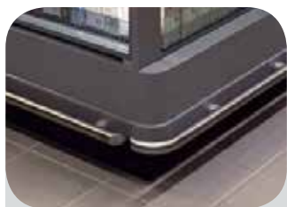
Osaka 3 Fascia inferiore Front base