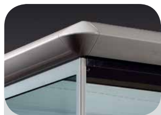
Osaka 3 Fascia superiore a becco Front curved trim