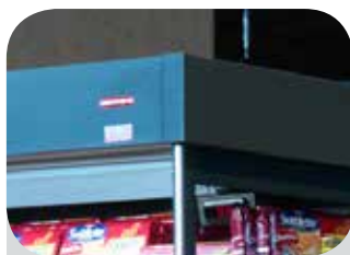
Osaka 3 P Fascia superiore piatta Top flat trim