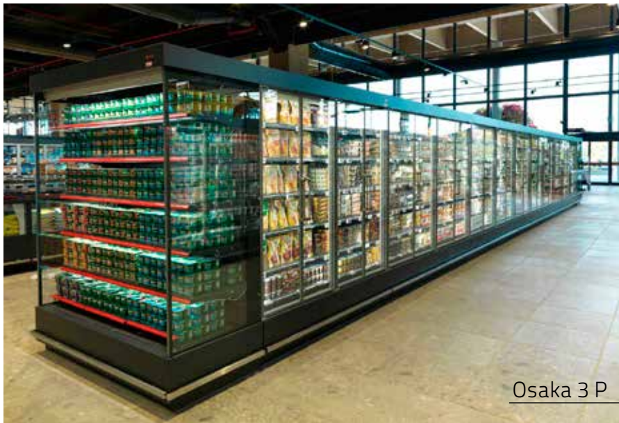
Osaka 3 P