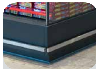
Osaka 3 P Fascia inferiore piatta Lower flat base