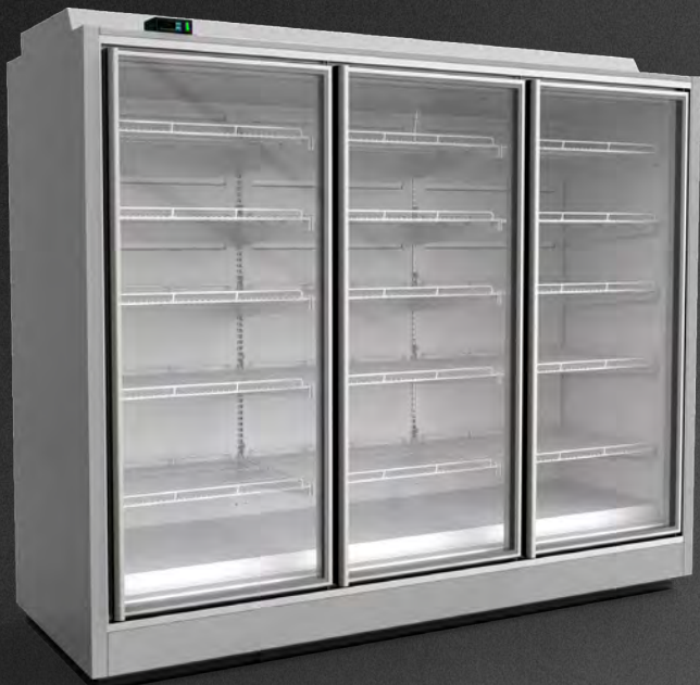
Glacier SNGL-L3 2342 DTO