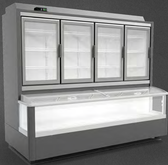
Mix MNMY-H2 2500 CCP