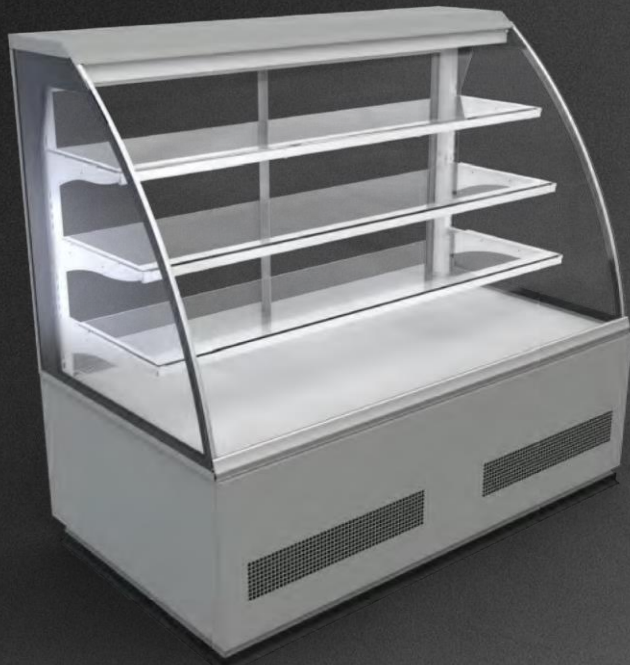
Elegant RDEL-05 1400 GBT